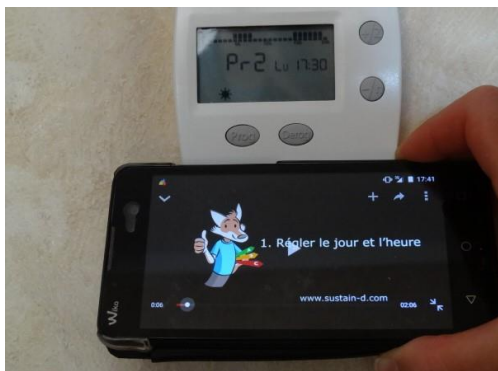
Tutoriel vidéo pour faciliter la prise en main des nouveaux équipements qui participent à la performance énergétique.